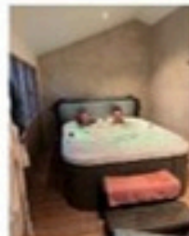
SPA avec Jacuzzi, sauna