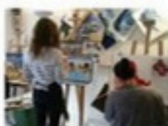
Des ateliers d'art-thérapie