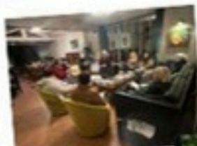
Des moments de détente et de convivialité...