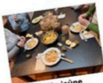
Un jeûne intermittent

497 € TTC en chambre seule (avec salle d'eau-WC)